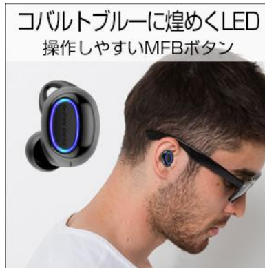
MFB ボタンがブルーに煌めく