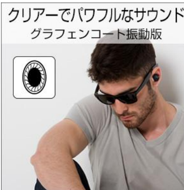
グラフェンコート振動板