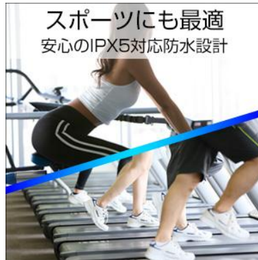
防水仕様で汗にも安心