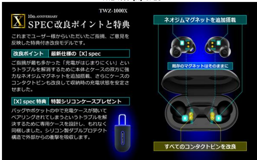
【X】SPEC 改良ポイントと特典