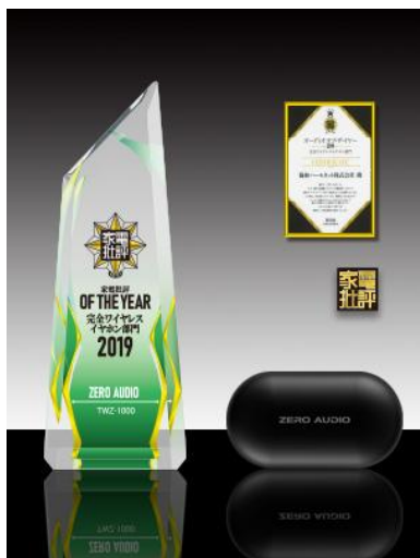
オーディオ オブ ザ イヤー 2019 年を受賞

「TWZ-1000」は家電批評(晋遊舎)の2020年1月号にて「2019年の完全ワイヤレス市場において飛び抜けた実力を有していた」と評価され、栄えある「オーディオ オブ ザ イヤー」(完全ワイヤレス部門)を受賞しました。