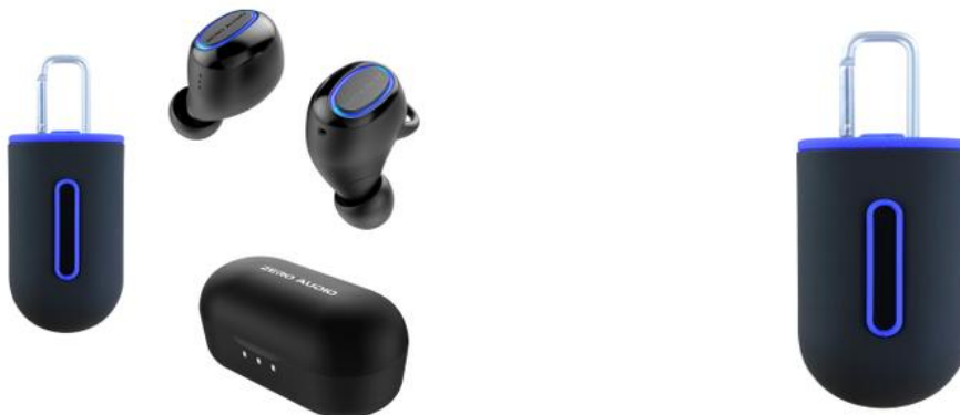
完全ワイヤレスイヤホン TWZ-1000 【X】 SPEC