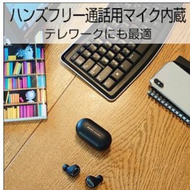
Web 会議やテレワークにも

エルゴノミクスデザインの快適な装着感により、装着するだけで周辺環境のノイズをしっかりガード。パッシブなノイズキャンセリングを実感できる。