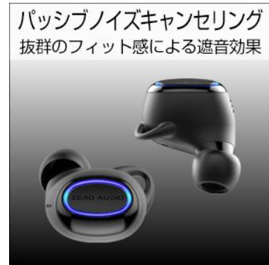
抜群のフィット感

耳へのフィット感を追求した 4 種類のシリコンカバーを同梱。自分に最適なサイズのイヤリングを選んで快適な装着感。