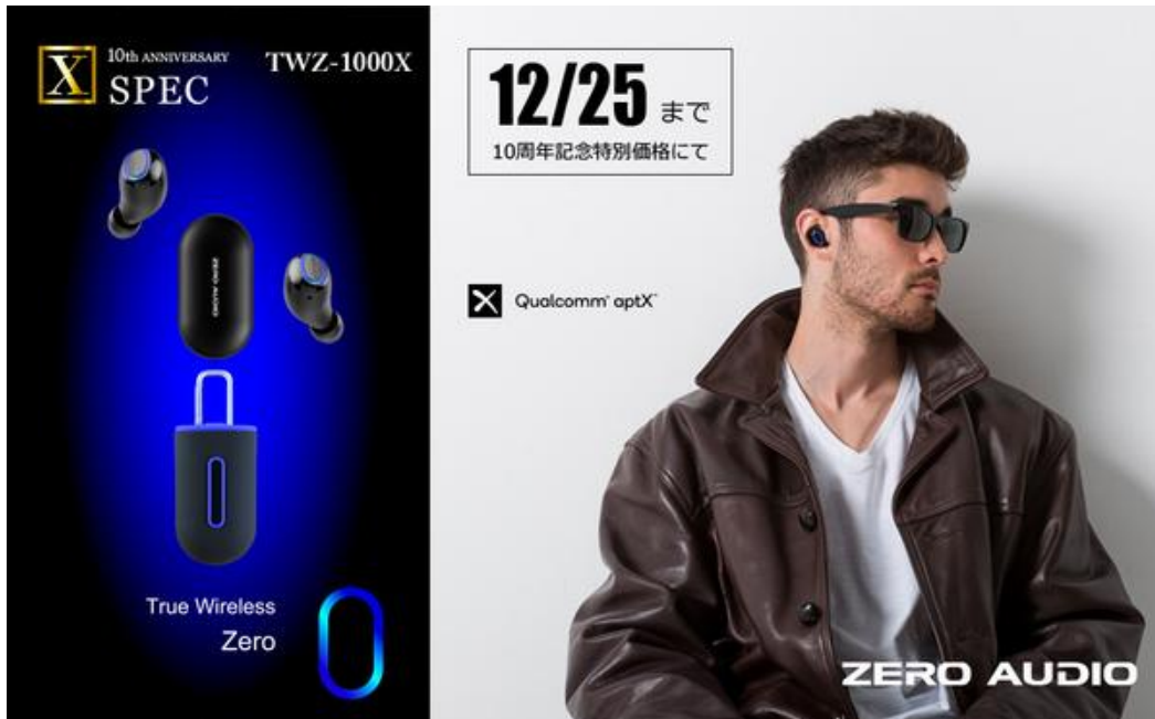
TWZ-1000 [X] SPEC