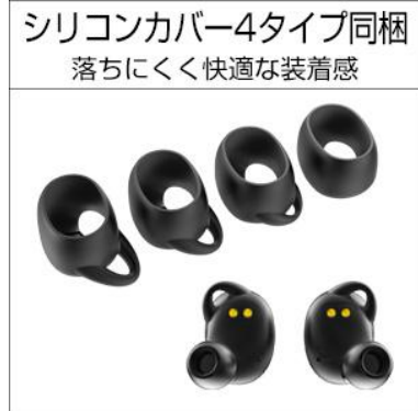
4 種類のシリコンカバー

省電力の QCC3026 の採用により、イヤホン本体の連続再生時間を 7 時間に、さらに小型充電ケースを使用することで最長総再生時間 28 時間を実現。※再生時間は接続条件、使用状態によって変動。